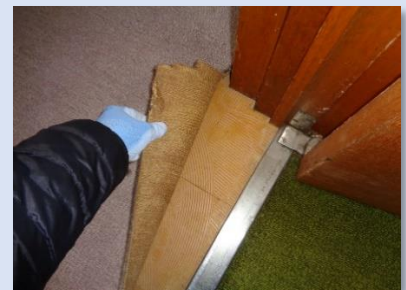
床材 100cm 2