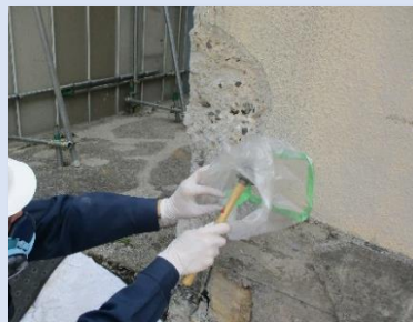
仕上塗材 10cm 3