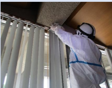
吹付け材 10cm 3